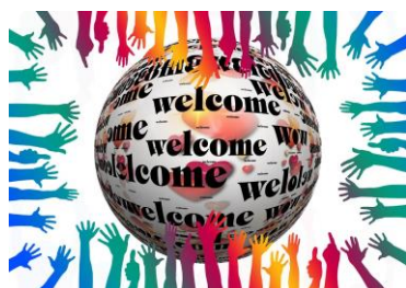
Kennismaking : associaties